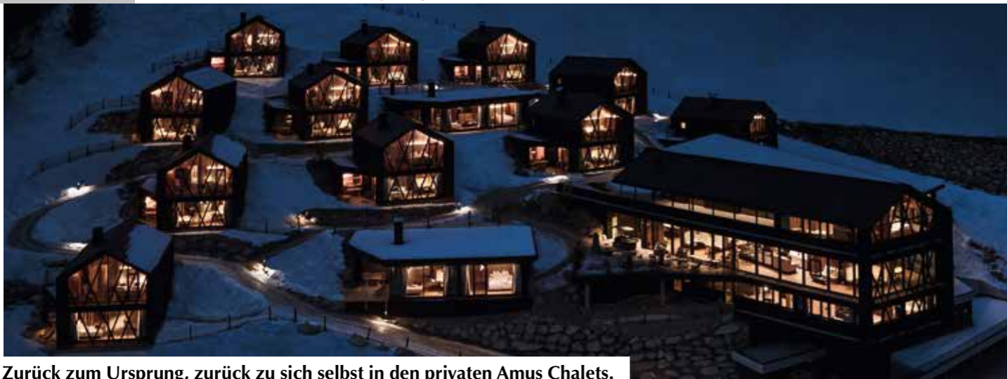
Zurück zum Ursprung, zurück zu sich selbst in den privaten Amus Chalets.