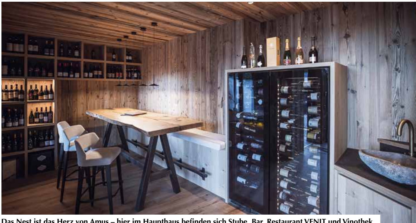
Das Nest ist das Herz von Amus – hier im Haupthaus befinden sich Stube, Bar, Restaurant VENIT und Vinothek.