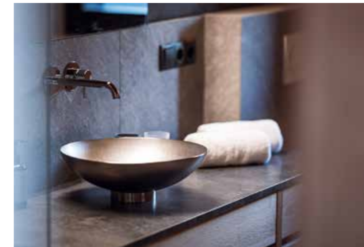
Eingerichtet mit bewussten, naturbelassenen Möbeln, Zirbensauna, Steindusche und vielen weiteren Extras wird man in den Amus Chalets eins mit der Natur. Das Augenmerk reicht bis ins kleinste Detail – etwa bis zur perfekten Auswahl des Leselichts, um unnötige Lichtverschmutzung zu vermeiden.